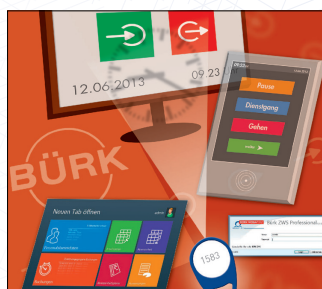
Zeiterfassung & Zutrittskontrolle