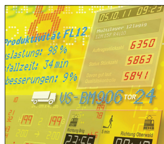
Anzeige- & Informationstechnik