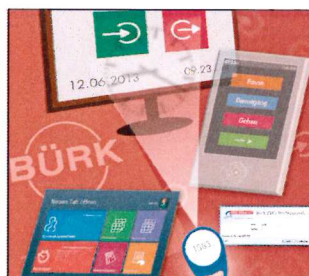
Zeiterfassung & Zutrittskontrolle